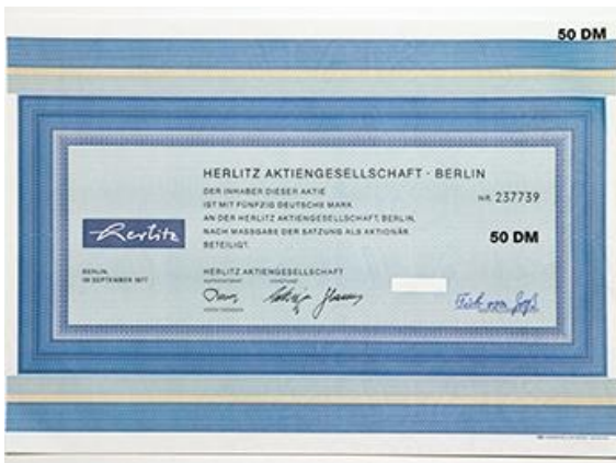
Historisches Aktienpapier der Herlitz AG

Obwohl Aktienkurse daher kurzfristig starken Schwankungen unterliegen können, haben sie sich langfristig als rentable Anlage bewährt. Mit europäischen Aktien konnten Investoren, trotz der Finanzkrise, in den Jahren 2005 bis 2015 durchschnittlich 4,8 Prozent Rendite jährlich erzielen.